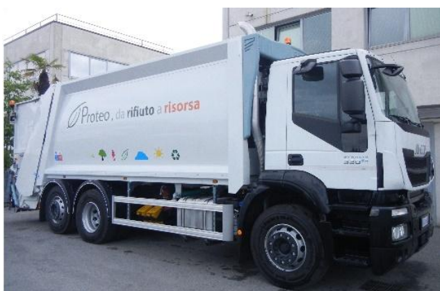
Foto indicative dei mezzi